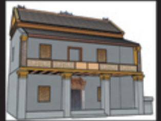
ภาพอาคาร Graphic 3D

ปัจจุบันอาคารไม่ได้รับการดูแลเอาใจใส่เท่าที่ควร มีการต่อเติมอาคารใหม่ที่ไม่เหมาะสมขัดกันหลังของอาคาร โดยเฉพาะอย่างยิ่งห้องน้ำ ซึ่งเป็นสาเหตุทำให้เกิดปัญหาเรื่องน้ำฝนและความชื้น นอกจากนี้อาคารยังถูกดบังทัศนียภาพ สภาพแวดล้อมบริเวณวัดไม่ได้รับการจัดการซึ่งอาจส่งผลเสียหายต่ออาคารในอนาคต เหตุผลด้านการท่องเที่ยวและการรื้อฟื้นประวัติศาสตร์ของชุมชนเพื่อเป็นแหล่งเรียนรู้ของเมือง ตำแหน่งของวัดช่างฆ้อง อยู่ในพื้นที่ที่เป็นศูนย์กลางของนักท่องเที่ยวที่มาเที่ยวเมืองเชียงใหม่ ได้แก่ ในท่ารถเข้าเขตกำแพงเมืองเก่า และย่านท่าแพ