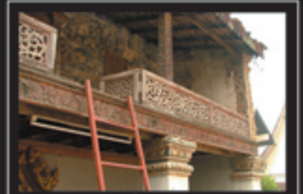
วดลวดลายไม้ของห้องบนลานนามสมพมา