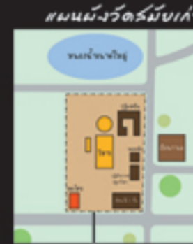
แผนผังวัดช่างฆ้อง