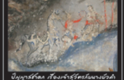
ปูนปั้นที่วัดช่างฆ้อง เรื่องเจ้าสุริยวงศ์กับนางบัวคำ