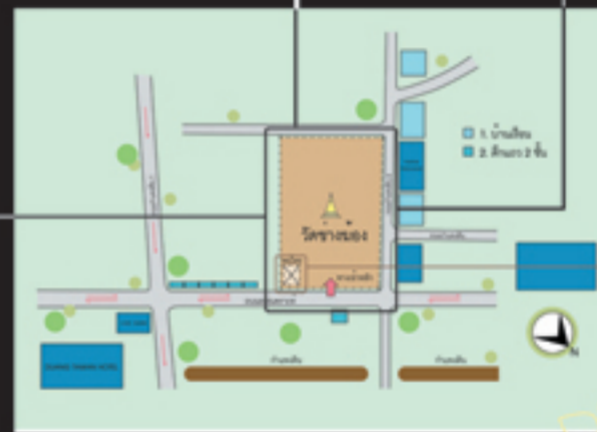
แผนที่แสดงที่ตั้งวัดและบริเวณโดยรอบ