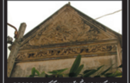
วดลวดลายของหลังคาหน้าจั่วของวัดช่างฆ้อง