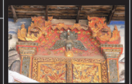
ประตูของวัดช่างฆ้องใน 2 รัชสมัย