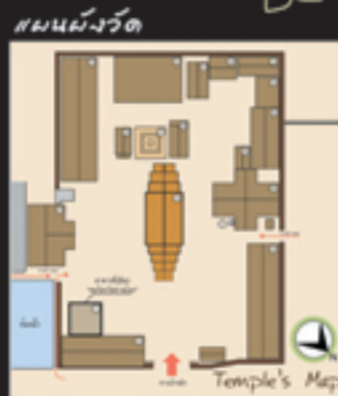
แผนผังวัด