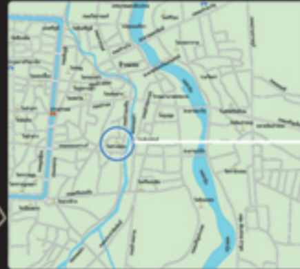
แผนที่เมืองเชียงใหม่