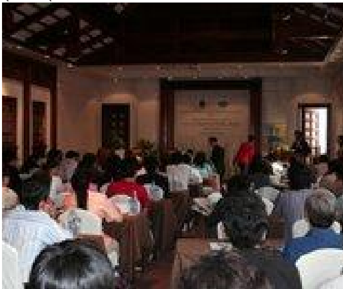
ภาพบรรยากาศภายในงาน

Dinner Talk "จะทำอย่างไร? เมื่อสถาปนิก.....ถูกโกง..."